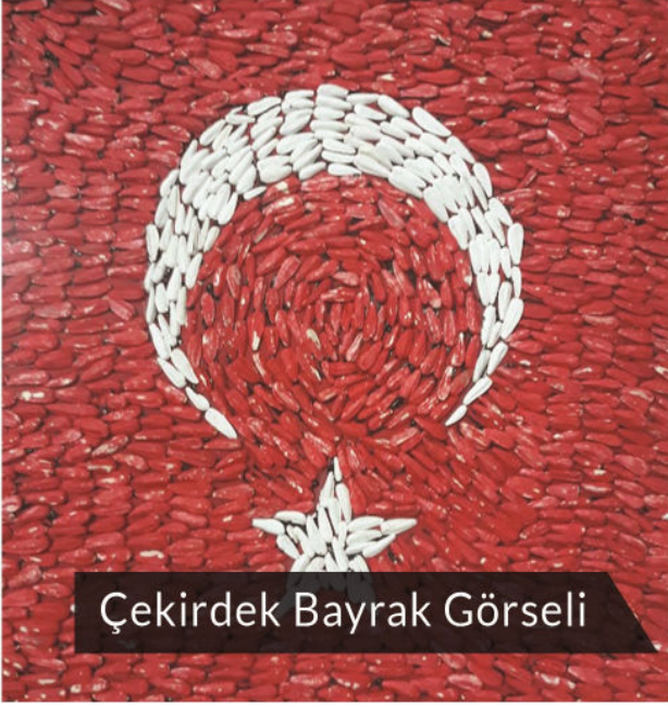
Çekirdek Bayrak Görseli